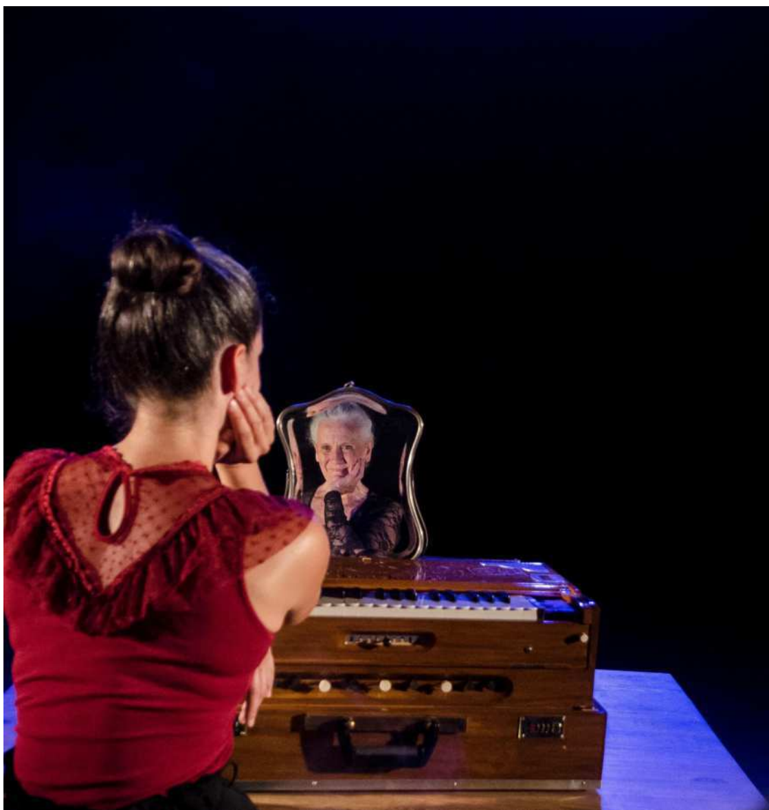
Deux âges, deux corps liés dans une partition poétique, dans un même « Souffle ».

Autour de « Souffle », elle a réuni des amis : le régisseur Cy-